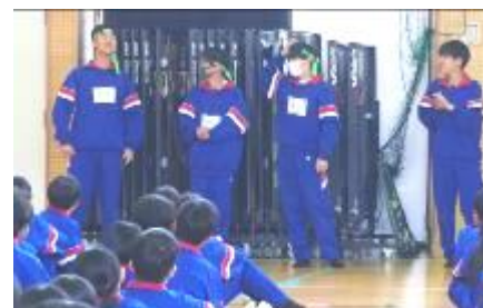
カラー抽選の様子

なお、体育大会は、10月5日(土)に予定しています。合唱コンクールは、11月1日(金)に予定しており、生徒全体で鑑賞し合えるような実施方法にする方向で進めています。