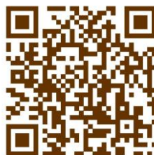
つながる河内長野メタバースにぎわい広場②

現在、メタバース空間で記念式典が開催されています。ここには、東中学校をはじめ、市内小中学校の子どもたちからの祝いメッセージ動画もあります。ご覧ください。