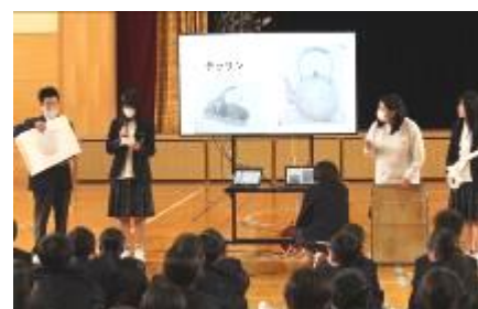
部活動紹介の様子