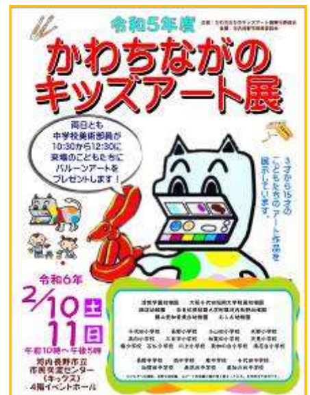
「かわちながのキッズアート展」