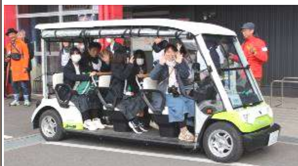
「クルクル 観ル 知ル 創ル」