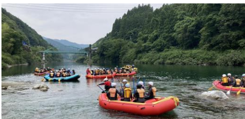
吉野川ラフティング

三日目、吉野川ラフティングへ。インストラクターと共にクラスの仲間4人から7人がボートに乗り、吉野川をくだる爽快な体験!昼食のカレーは、おかわりができなくなるまで完食しました。