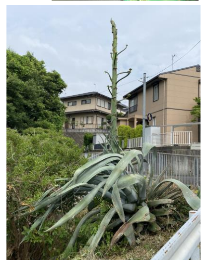
東中学校の体育館側から、橋を渡って清見台に行くと見えます