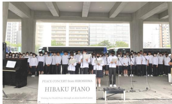
平和祈念式 「ねがい」合唱

初日の夜は、国民宿舎みやじま「杜の宿」に宿泊。クラスレク、クラスミーティングで仲間の新たな一面に気づいたようです。