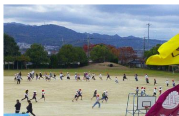
〈長休みの練習風景〉

なお、 雨天の場合、12月5日(金)に延期 します。この場合は、テトルにてお知らせします。