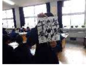
個性派の馬たち!!躍動する!