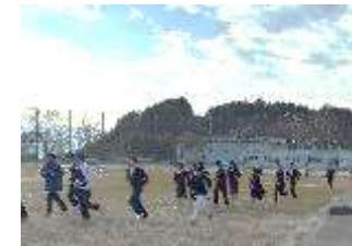
スムーズに避難できました

この日の6時間目、地震を想定した避難訓練を行いました。どのクラスも私語をせずに迅速に避難が出来ました。校長からは、家に帰ったらこんな場合どこへにげるか家族で話し合ってくださいと話がありました。普段からの災害に対する備えをしていると、いざというときに迅速に行動でき命を守ることにつながります。