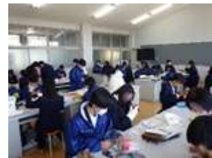
いい作品が出来ているかな?

家庭科の被服実習の作品制作が完成に近づいてきました。毎回たくさんの地域の方がサポートに来てくださっています。なかなか家庭では裁縫やミシンをする機会がないのでわからないこともたくさんありますがサポートのおかげでよい体験となっています。