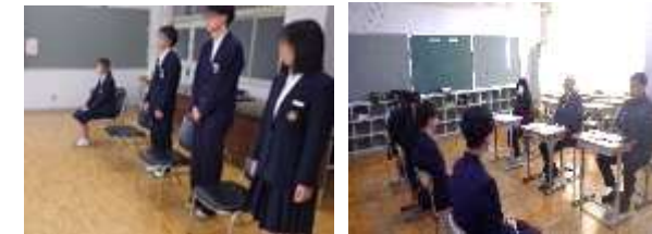
緊張もその中で考えて話すのも大事な経験

3年生は入試に向けて面接練習を行いました。面接官は地域の方に参加していただいています。どの生徒も自分の順番が来るまでは大変緊張している様子でした。いざ面接を始めると例年に比べてよく練習し、考えて答えられている印象を受けました。面接が終わり、緊張が解け安心して話をする様子も見ることが出来ました。入試で面接がない生徒もいますが、これからバイト先や就職活動できっと役に立つことでしょう。