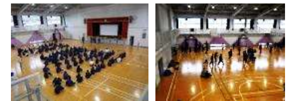
静と動のある集会でした

6限目に体育館で生徒総会を行いました。後期の専門委員の活動報告を行いました。その後、南花台中学校とのリモート長縄対決に向けて全学年練習を行いました。みんながみんなを応援するあったかい練習となりました。