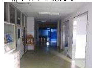
うっすら形が見えてきました

PC準備室は今工事を行っています。令和9年1月からの給食開始のための仮の配膳室と、小中一貫化のための購買室をつくるためです。真っ暗だったPC室前が少し明るくなっています。