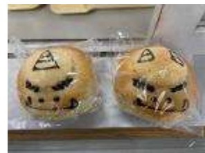
静かわいい鬼たち

節分にかけて購買では鬼パンが用意されています。角一本の鬼はチョコレート、角二本はカスタードが入っています。かわいい鬼さんをぜひ食べてください。