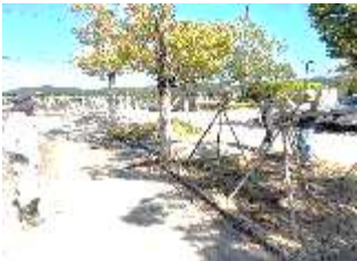
地域の方による稲架づくり

体育大会の翌週、よく晴れた金曜日の放課後、美加中米を収穫しました。地域の方が先に来てくださり、稲架(はさ 稲を干すところ)を作ってくださいました。テスト終了後の15名ほどが集い、のこぎり鎌をつかって青空の下、黄金色に輝く稲をざくざく収穫しました。初めて鎌を使う生徒ばかりでしたが、地域の人に教えていただいた後は、後から来る生徒に先に習ったことを優しく教えてあげている場面もありました。刈り取った稲は丁寧に並べて束にしていきます。地域の方に教えていただきながら上手に束ね最後に稲架掛けをしました。このまま天日干しで2~3週間干した後、脱穀、精米へと進んでいきます。自分たちで田んぼづくりから稲刈り、稲架掛けまで終えた達成感に子どもたちからは素敵な笑顔があふれていました。