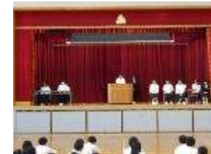
それぞれが熱く主張

6 時間目に立会演説会を行いました。今回は全ての役職が複数立候補し選挙となりました。どの候補者も学校を楽しく、また他学年との交流を深める活動を訴えていたのが印象的でした。選ばれた役員は美加中を前に進めていってください。