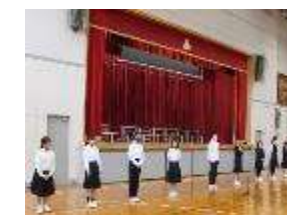
やる気が姿勢に表れる