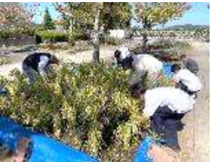
ザクザク稲刈り開始