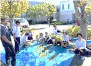
素敵な笑顔があふれていました。