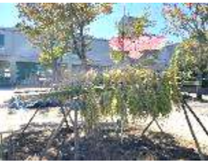
守護神も引っ越し完了