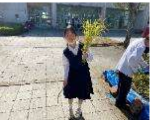
上手に刈れました