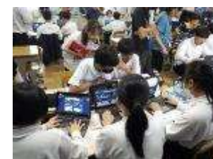
夢中になって考える

この日は午後からシンキングツールの研究授業を行いました。三角形の相似を見つけるという内容ですが、どの生徒も意欲的に授業に参加し、どの班も話し合いを積極的に行いました。その後、小中の先生で研修を行いました。