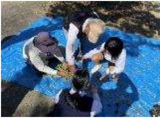
とれた稲をきれいに束ねて