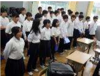
みんなを盛り上げるコメント