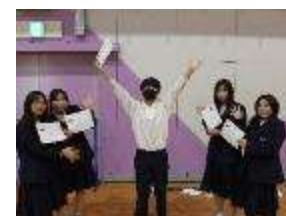
貫禄のベテラン勢

6 時間目、後期役員、委員会の認証式を行いました。前期役員の貫禄のあいさつ、新委員が緊張して話をする姿は、どちらも印象的でした。1 年前に役員になった先輩たちも緊張していたことが懐かしく思い出されます。役職は人を育てるという言葉がありますが、本人たちが生徒の代表となるため、学校をよくするため周囲の期待に応えるため努力した様子が見受けられます。また、背筋をピンと伸ばしてみんなの前に立つ後期委員の姿に頼もしさを感じました。