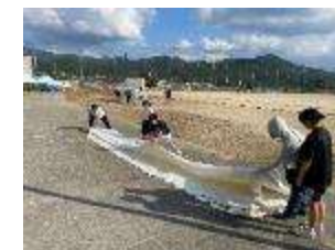
自分たちの手で協力して

体育大会の代休の後、放課後生徒で片づけを行いました。雨をしのいだたくさんのテントを1、2年生が分担して分解し倉庫へきれいに片づけていきます。来年も盛り上がる体育大会になるといいですね。