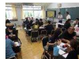
先生たちも夢中で話し合う