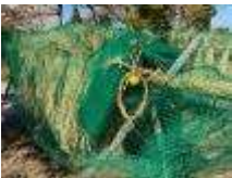
↑つぎの「なんだこれは」稲架にかかっています。