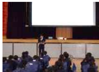
耳を傾ける大切さ