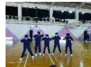
練習してそろえて...

体育では全学年でダンスの授業を行っています。チームに分かれタブレットを使いながら踊りの選択や構成について話し合いながら練習する様子がみられました。