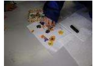
色鮮やかな押し花