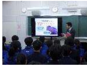
身近なことと考える

2年生は薬剤師の先生をゲストティーチャーに招き薬物乱用防止教室を行いました。1時間目はアルコールについて学びました。アルコールの依存性や害について、またパッチテストも行いました。2時間目は薬物の危険性について学びました。身近に潜む危険について理解することができました。