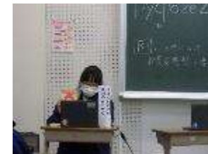
白熱のBIグランプリ

市内の中学校が、WEBでつながってビブリオバトルを行う、BIグランプリが開催され、2年生の代表と生徒が参加しました。どの学校もハイレベルな書評で生徒たちも聞き入っている様子を見ることができました。数少ない市内の学校と交流できる機会となりました。