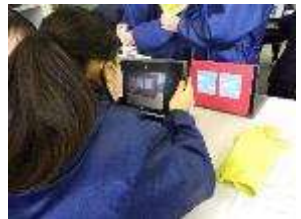
壁は画用紙、窓はタブレット映像

2年生は家庭科でパペットを作り映像を作っている。画用紙を組み合わせて工夫して作っています。班でうまくいように相談している様子が見られました。自動運転のプログラムを組んだ車を作っています。ど組んだらうまくいか考えながらトライアンドエラーを子が見られました。