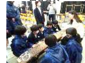
大きな琴に興味津々

プロの琴奏者をゲストティーチャーに招いて1年生は6限目に体験授業を行いました。最初に演奏を聴いた後、琴に近づき音の大きさを体験したり、実際に触れて振動を感じていました。みんなが知っ