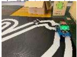
未来の街づくりに役立つかも