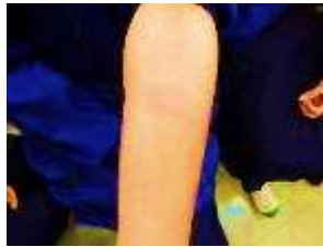
アルコールに強いかな？