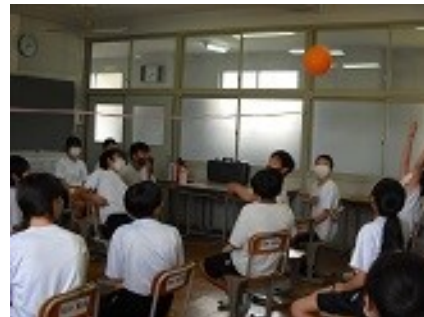
イスに座って風船バレー