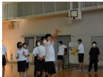
美しいシュートフォーム