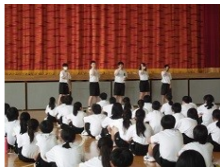
みんなで盛り上げよう!

先日、体育大会の団の色を決める「カラー抽選」が行われました。生徒会主催で、「風船バレー」「フリースロー」「バドミントン」など、生徒会のメンバーが考案したゲームを行い、所属する団のイメージカラーを決定しました。