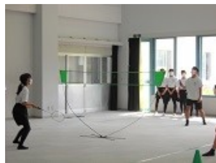
バドミントンの様子