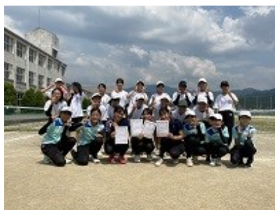
女子硬式テニス部