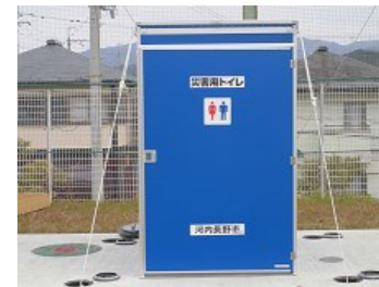
マンホールトイレ 車いす対応のため男女兼用

6限目に、運動場に避難した生徒たちは、設置したマンホールトイレを見学しました。土曜参観を利用し、保護者、地域のみなさんと一緒に防災訓練に取り組むことができ、大変有意義な活動でした。