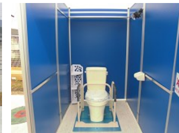
トイレの内側 手すりもあります