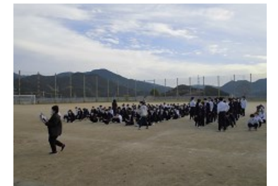
地震対応避難訓練で運動場に集合した生徒たち