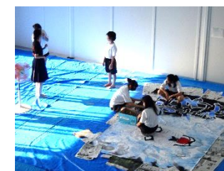
制作も佳境に入ってきました