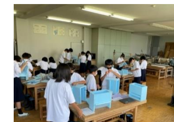
個性あふれるプランター

2年生は技術のプランターの制作を行いました。1学期に個々に設計を行いプランターを製作します。材料は発泡スチロールで非常に作りやすく、工夫をしやすいものになっています。様々なプランターが完成した後、今度は栽培の分野で実際に栽培を行います。うまくいくかどうかはプランター次第。今ある物の形がなぜその形になったのか物事を深く考えるよい機会になります。