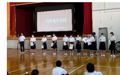
厳しい夏を乗り越え実りの秋

長い夏休みが終わり、2学期がはじまりました。校長からは1学期に引き続きいろんなことにチャレンジしようという話がありました。体育大会、文化祭などチャレンジすることはたくさんあります。ぜひ自分の成長の機会にしてください。教頭からは、熱中症予防、学校の補修についての話をしました。最後に、女子テニス部、女子バスケットボール部の表彰を行いました。夏の頑張りの成果が出たようです。女子テニス部は府大会へ進出します。