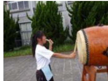
リーダーの指示できびきびと