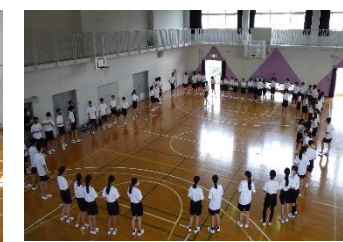
気持ちをそろえる両団