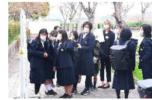
ドキドキのクラス発表

桜の花から若葉に季節が変わり、さわやかな天気の中、第33回入学式を挙行し、制服姿も初々しい46名の1年生が入学しました。クラス発表の紙を一生懸命に見る様子、入学式では胸を張って入場する凛々しい姿を見ることができました。