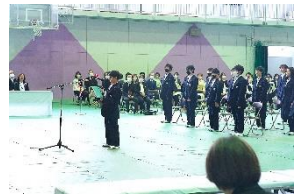
新入生誓いの言葉