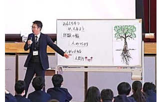
幹をしっかり育てよう