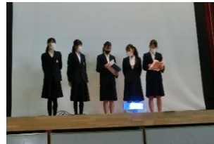
盛り上がった対面式