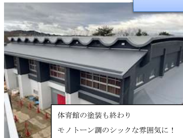
体育館の塗装も終わり モノトーン調のシックな雰囲気！