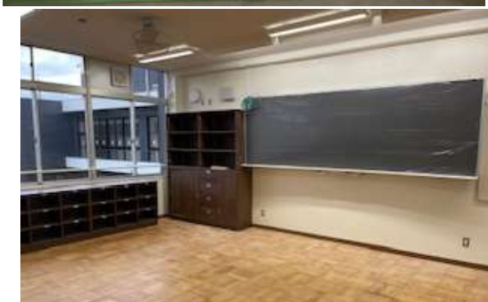
教室も床の張り替え、ロッカーや黒板の設置完了！