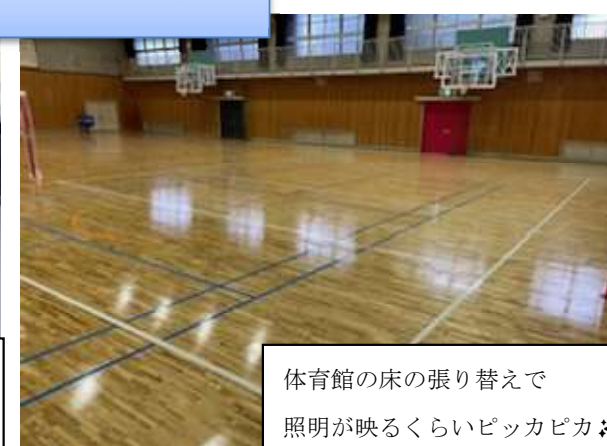
体育館の床の張り替えで 照明が映るくらいピッカピカ！