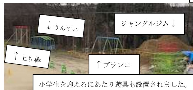
↓ うんてい ジャングルジム ↓ ↑ 上り棒 ↑ ブランコ 小学生を迎えるにあたり遊具も設置されました。 小学生優先でお願いしますね。