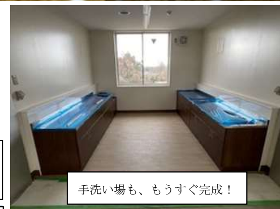
手洗い場も、もうすぐ完成！