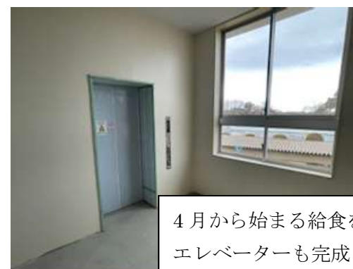
4月から始まる給食を運ぶ🍴🍴 エレベーターも完成！