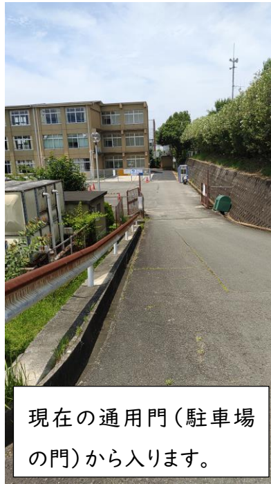
現在の通用門（駐車場の門）から入ります。