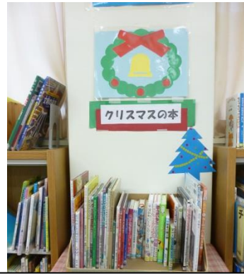
クリスマスの本のコーナー