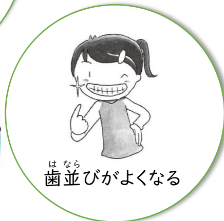
歯並びがよくなる