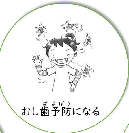
むし歯予防になる

「よくかんで食べましょう」と言われるのは、いいことがいっぱいあるからです。どんないいことがあるか確認しましょう。