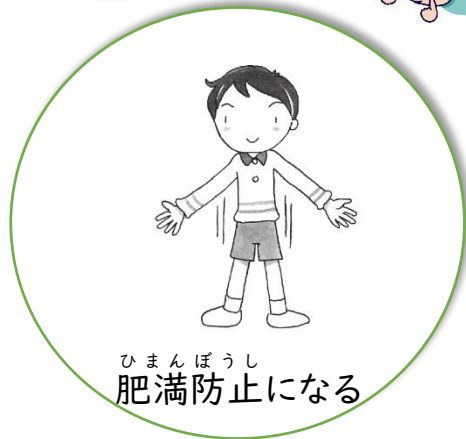
ひまんぼうし肥満防止になる