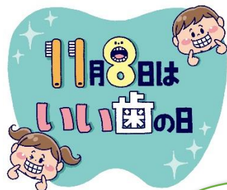
歯並びがよくなる