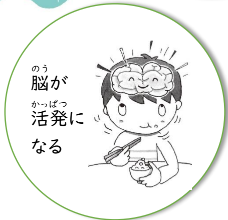
脳がかっぱつ活発になる