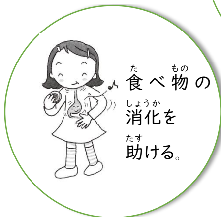
食べ物の消化を助ける。

「よくかんで食べましょう」と言われるのは、いいことがいっぱいあるからです。どんないいことがあるか確認しましょう。