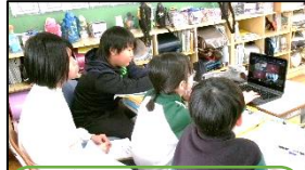
5年生の楠小学校との遠隔授業。お互いの学びを発表・交流しました。

いよいよ3月。6年生が小山田小を巣立つ日も目前です。お別れ会で大切な思い出をつくり、委員会やクラブを引き継いだり、それぞれが自分らしく卒業の日を迎えられるよう、学校全体で一日一日を大切に過ごしたいと考えています。